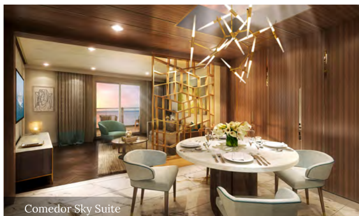
Comedor Sky Suite

Apresentamos as Sky Suites: Desfrute. Celebre. Toque o céu. Navegue com tratamento VIP no Sky, Enchanted e Discovery Princess, as nossas suites mais exclusivas e premium até ao momento. Relaxe em sua casa, fora de casa – dois quartos, duas casas de banho equipados com a Princess Luxury Bed e mais de 92 m2 contínuos de varanda. Sente-se em cima do mundo enquanto contempla as vistas panorâmicas de 270 graus. Desfrute de um serviço incomparável desde o momento no qual reserva com um concierge pré cruzeiro e uma experiência perfeita na sua suite.