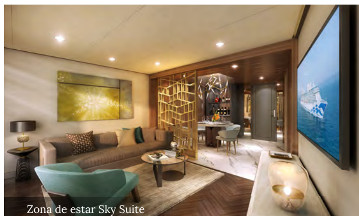
Zona de estar Sky Suite