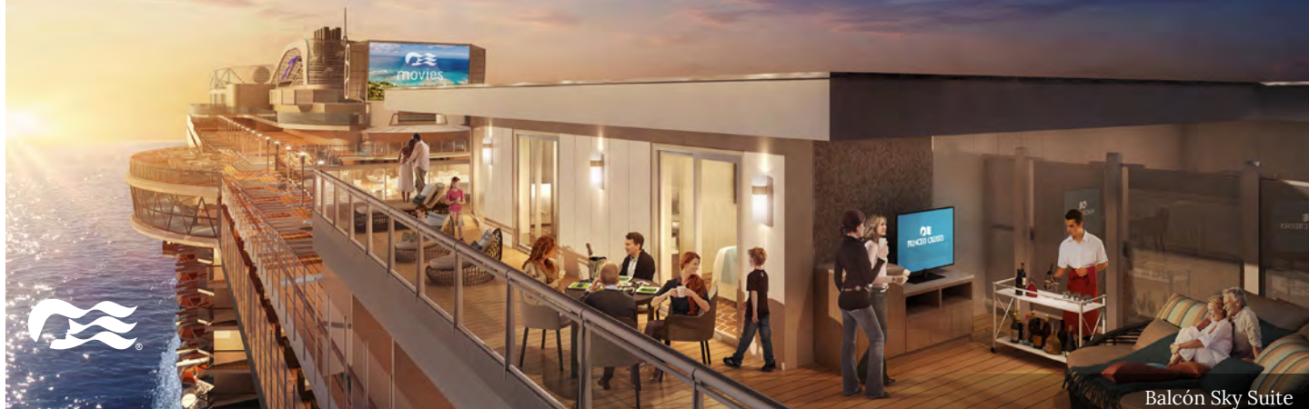
Balcón Sky Suite