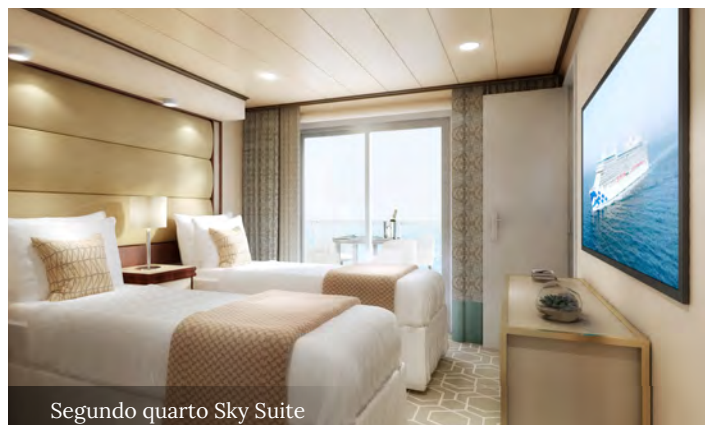
Segundo quarto Sky Suite