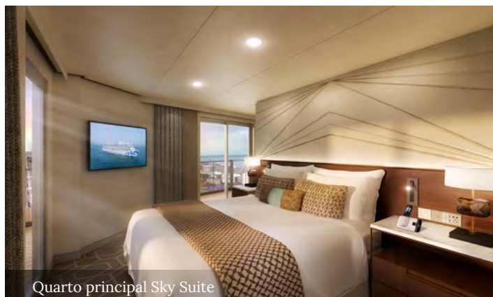
Quarto principal Sky Suite